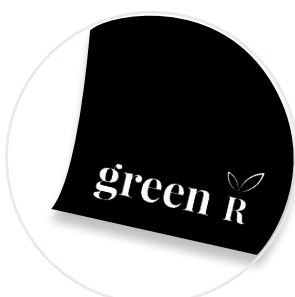
Application fond noir